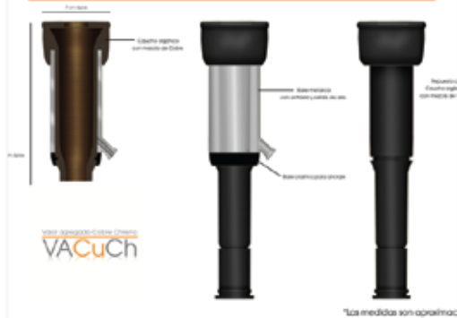
Diagrama - pezoneta de caucho orgánico con mezcla de Cobre